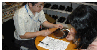
お客様と素材を見直し中