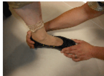
フィッティングチェック